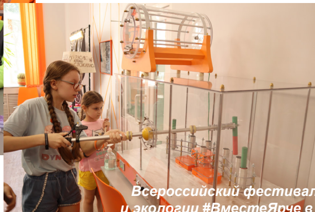
Всероссийский фестиваль энергосбережения и экологии #ВместеЯрче в Смоленской области, 2022